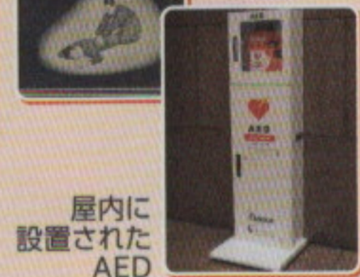
屋内に設置されたAED