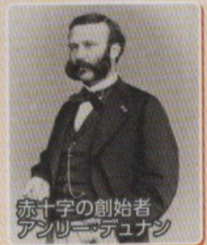
赤十字の創始者 アンリー・デュナン

赤十字の創始者であるアンリー・デュナンは、1859年6月イタリア統一戦争の激戦地ソルフェリーノの近くを通りかかり、「傷ついた兵士はもはや兵士ではない、人間である。人間同士としてその尊い生命は救われなければならない」との信念のもとに救護活動にあたりました。その「いのちを守る」想いは、今も赤十字活動の根幹となっております。