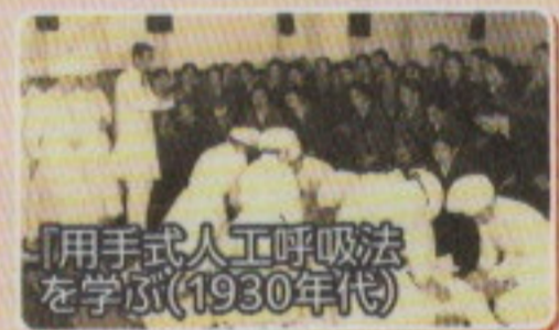
「用手式人工呼吸法を学ぶ(1930年代)」